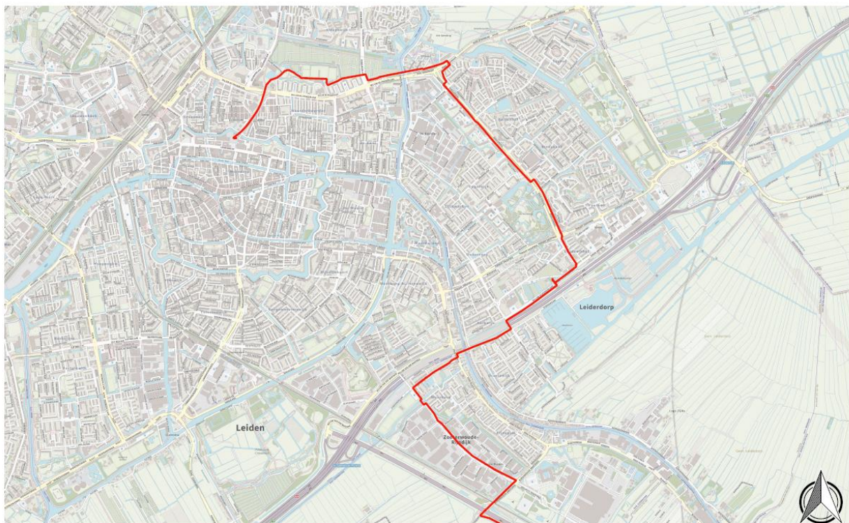
Figuur 1 - Conceptleiding tracé warmterotonde in de regio Holland Rijnland

De beschikbaarheid van warmtebronnen die warmte geven aan het regionale net hangt af van hoeveel restwarmte van de industrie in voornamelijk de Rotterdamse haven beschikbaar kan worden gemaakt en van de ontwikkeling van geothermie in voornamelijk het Westland. De theoretische potentie, zoals CE Delft in beeld heeft gebracht voor de Warmtealliantie, is voldoende om de geschikte warmtevraaggebieden in de regio rondom Leiden van warmte te voorzien. Voor het daadwerkelijk leveren van deze warmte aan Holland Rijnland zijn naast de transportinfrastructuur ook besluiten nodig over de aan te sluiten gebieden, en bijvoorbeeld het marktmodel en de financiering van het regionale net.